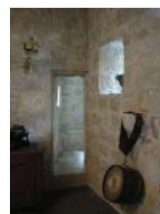
La mairie-école (ancien château) : entrée de l'échauguette de la tourelle d'angle