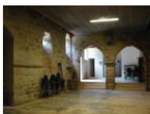
La mairie-école (ancien château) : vue intérieure du rez-de-chaussée de l'aile ouest