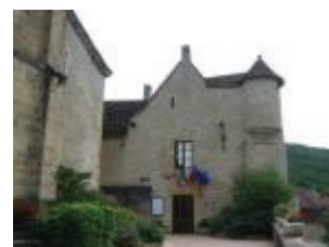
La mairie-école (ancien château) : vue générale depuis le parvis de l'église