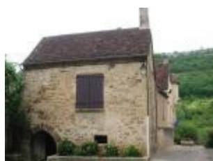
La mairie-école (ancien château) : la façade est de l'aile nord