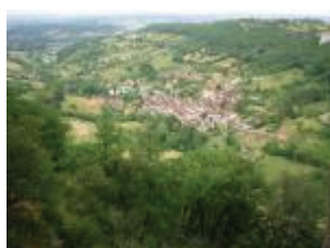
Le village d'Autoire au creux d'un vallon