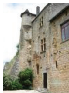
La mairie-école (ancien château) : la façade de l'aile ouest