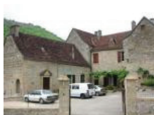
La mairie-école (ancien château) : vue générale des corps de bâtiments ordonnés en U autour d'une cour