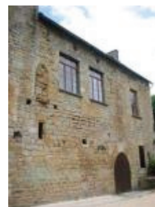
La mairie-école (ancien château) : la façade ouest de l'aile ouest