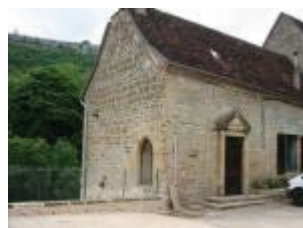
La mairie-école (ancien château) : l'extrémité sud de l'aile ouest